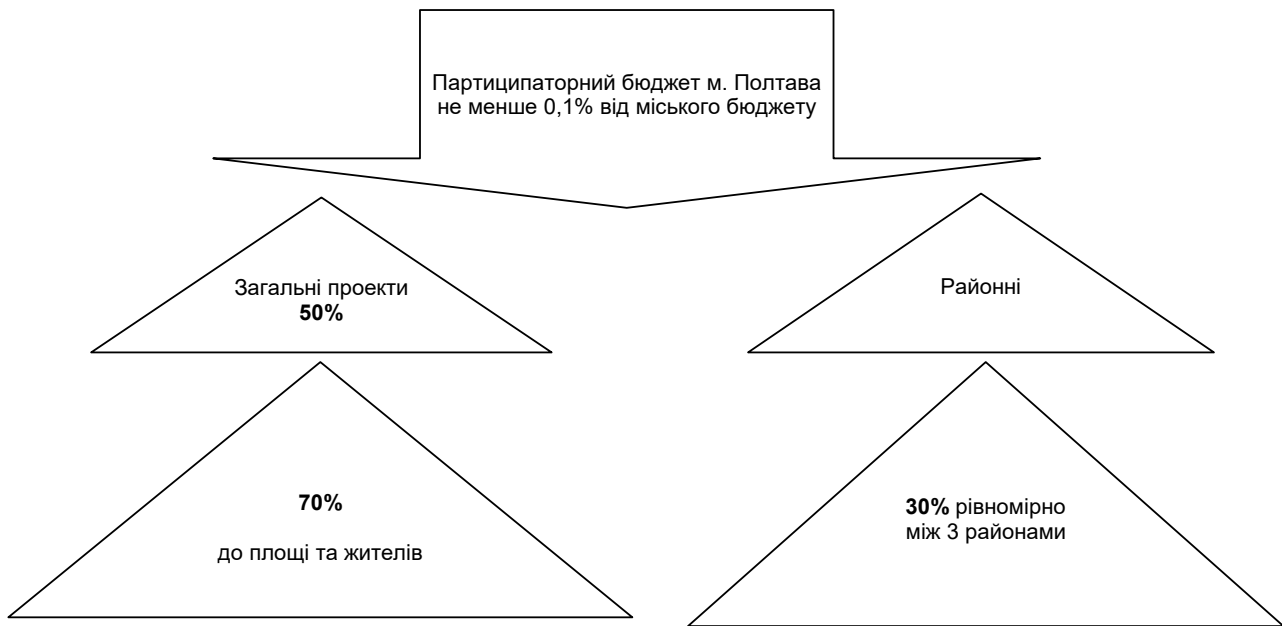
Рис. 2. Схема розподілу партиципаторного бюджету м. Полтава

У 2016 р. на конкурс “Бюджет участі” м. Полтава було подано 57 проектів, з них 54 були допущені до голосування, серед яких соціально-профілактичний проект “У здоровому тілі – здоровий дух!” [11]. У рамках цього проекту вже організовано три великих заходи у дворах міста та встановлено шість турніків. Реалізацію цього проекту буде продовжено. На цьогорічний проект “Бюджет участі” полтавці подали 92 ідеї, що перевищує кількість поданих торік майже вдвічі. З них, великих проектів (до одного мільйона гривень) – 21 та малих (до 300 тис. грн) – 71 проект. Більшість проектів, що подають полтавці, – інфраструктурні. Найбільше проектів – понад 70 – стосуються благоустрою територій, будівництва та реконструкцій дитячих і спортивних майданчиків, зон сімейного відпочинку, скверів та парків.